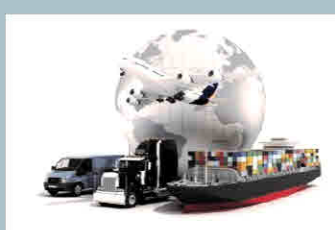
Livraison par camion ou par container maritime