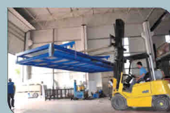
Déchargement par grue ou par chariot élévateur