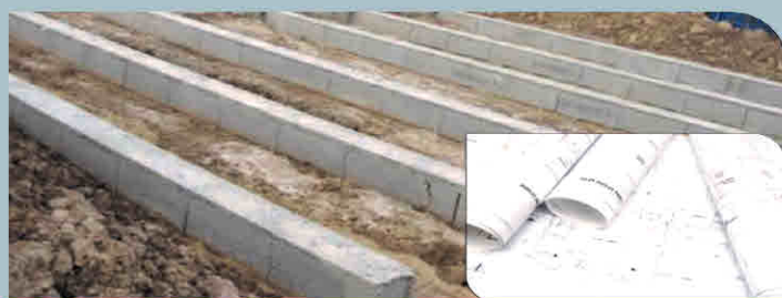
Fourniture des plans de fondation, d'électricité et d'arrivées d'eau et évacuation